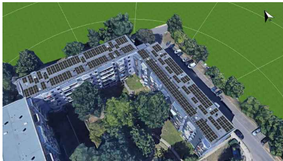
Saalfeleder Straße 21-31, 211 kWp