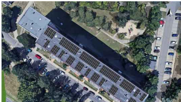
Otto-Lummer-Straße 2-10, 100 kWp